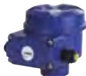
Aluminiumgehäuse, druckfeste Ausführung mit erhöhter Sicherheit