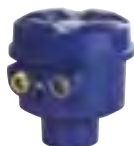
Aluminiumgehäuse, druckfeste Ausführung